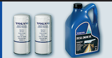
Niebieski: Obsługa zapobiegawcza